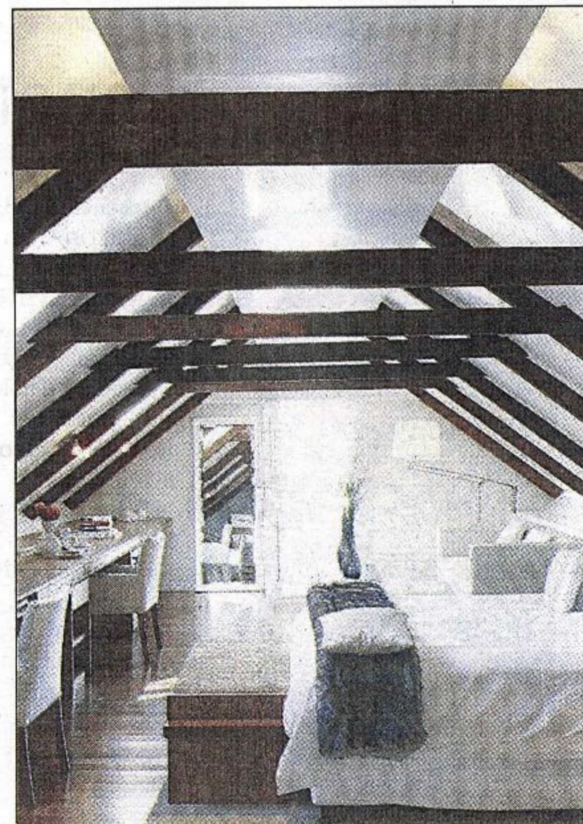
Die wittebrood-suite – die ou stal is in 'n luukse kamer omskep.

Die Cloverfield-kelder bied – met sy wyne én oulike restaurant – baie goeie waarde vir geld. Die gehoute chardonnay en sauvignon blanc is heerlike drinkwyne ideaal vir 'n mooi herfsdag.