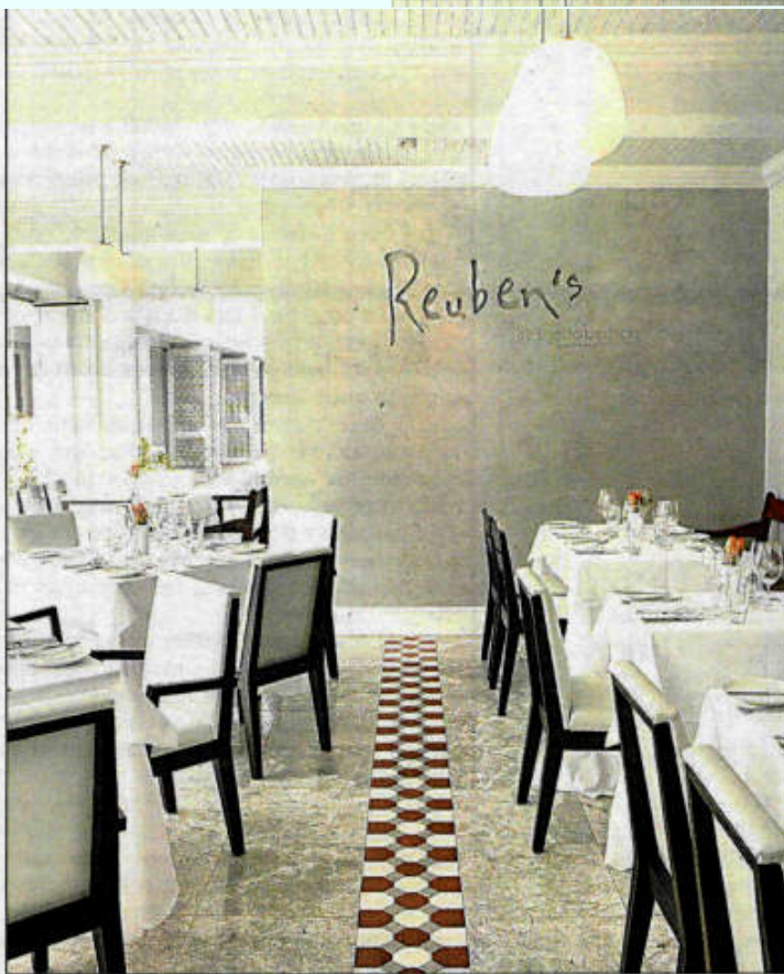
Die restaurant in die hotel, Reuben's, met as chef patron die bekende Reuben Riffel.

Wie kan nou die versoeking van só 'n lieflike swembad-suite weerstaan?